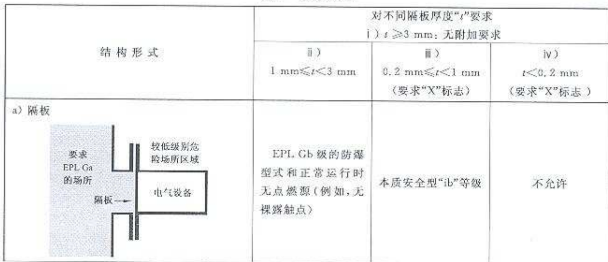
表 1 隔离部件

注：本条中“均质”一词的意思是由单块材料构成的不带任何插入件(例如，连接线、绝缘套管)的隔板。